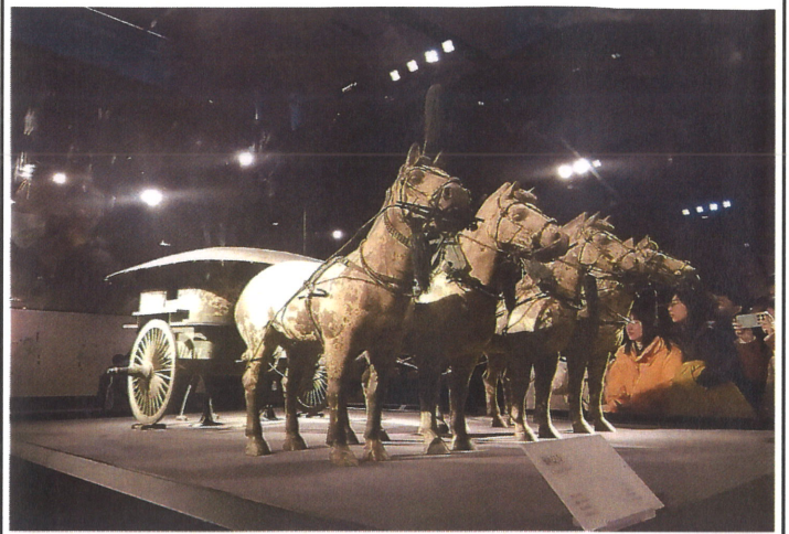
【秦の始皇帝陵 銅車馬】