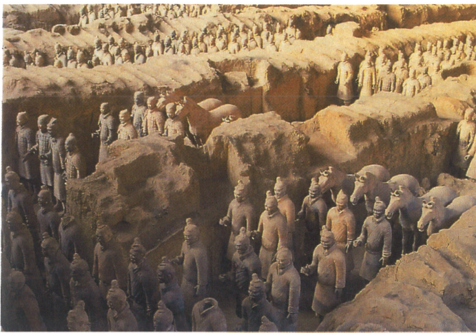
【兵馬俑博物館 1号坑】