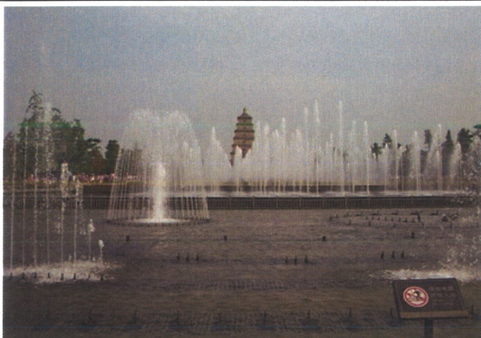
【大雁塔広場噴水ショー】